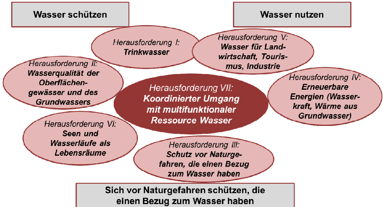
Abb. 2 Herausforderungen für den Umgang mit dem Wasser im Kanton Wallis

Die Herausforderungen I bis VI beziehen sich jeweils auf bestimmte Aspekte der Nutzung des Wassers, des Schutzes des Wassers und/oder auf den Schutz vor Naturgefahren, die einen Bezug zum Wasser haben. Von übergeordneter Bedeutung für alle Herausforderungen ist die Gewährleistung eines koordinierten Umgangs mit der multifunktionalen Ressource Wasser (Herausforderung VII) (vgl. Abbildung 2).