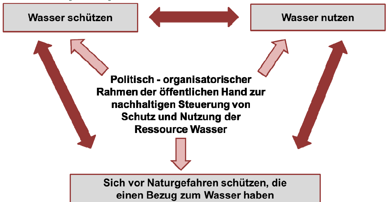
Abb. 1 Nachhaltige Entwicklung im Bereich Wasser

Wasser ist eine unverzichtbare Ressource für alles Leben. Die Bevölkerung und die Wirtschaft nutzen das Wasser insbesondere als Trinkwasser, für die Bewässerung, für Industrieanlagen oder für die Energiegewinnung. Die vielfältigen Nutzungsansprüche können zu Konflikten zwischen den verschiedenen Nutzungsinteressen, aber auch zwischen der Nutzung des Wassers und dem notwendigen Schutz des Wassers führen. Darüber hinaus gilt es, die Bevölkerung, die Gebäude und Infrastrukturanlagen sowie das Kulturland vor den Naturgefahren zu schützen, die einen Bezug zum Wasser haben (Hochwasser und Überschwemmungen, Lawinen, etc.).